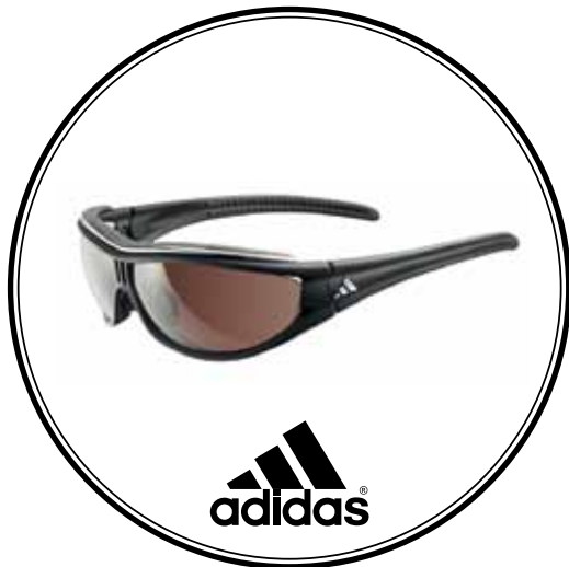
Adidas sportzonnebril vanaf €169 (op sterkte vanaf €289)