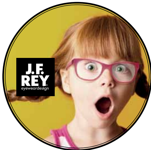
Kinderbrillen inclusief ontspiegelde glazen vanaf €149