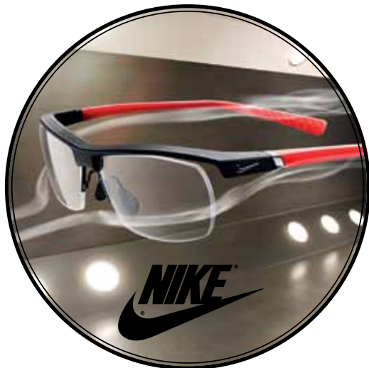
Nike Sportbril op sterkte vanaf €159 incl. glazen (ook handig als reservebril)