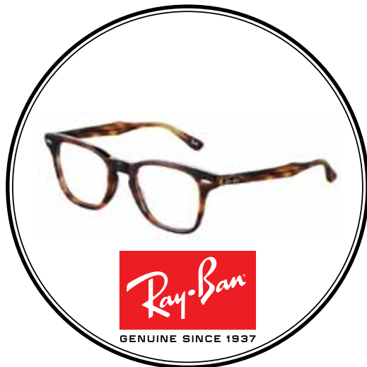
Ray-Ban Brillen vanaf €109